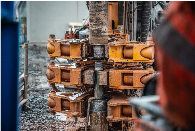
(3) Drei Bohrteams waren vor Ort im Einsatz.